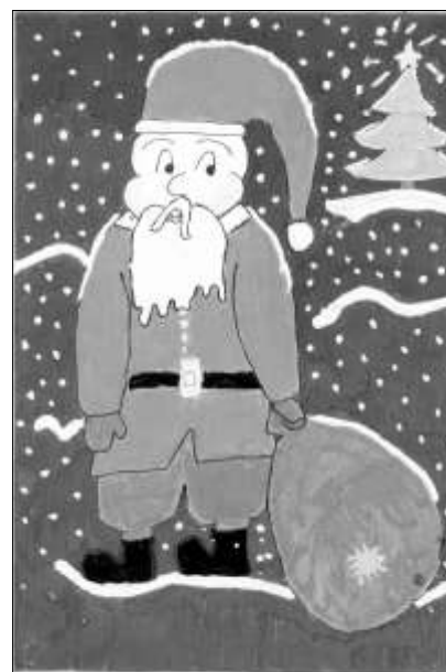
Kasia Pazdrowska kl VIb