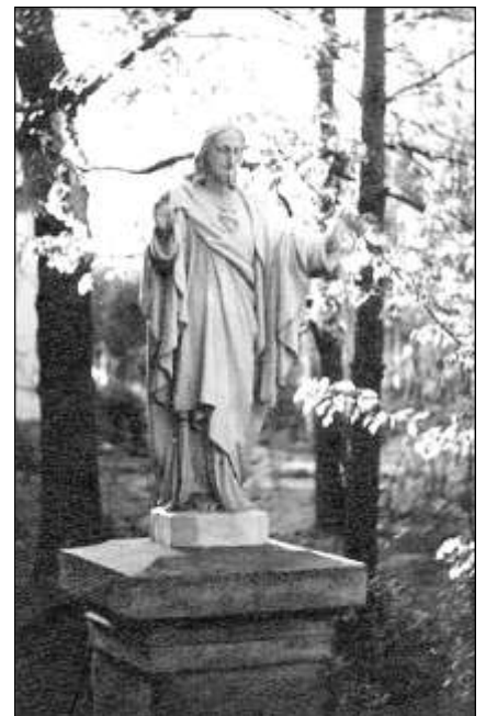
Figura Chrystusa z ul. Przebudzenia Wiosny, zdjęcie z lat 30-tych