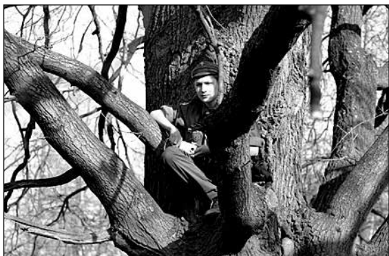
Dąb naszych harcerzy w finale konkursu na „Drzewo Roku”