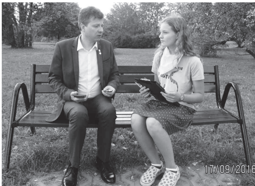
Wywiad z Rzecznikiem Praw Dziecka Markiem Michalakiem