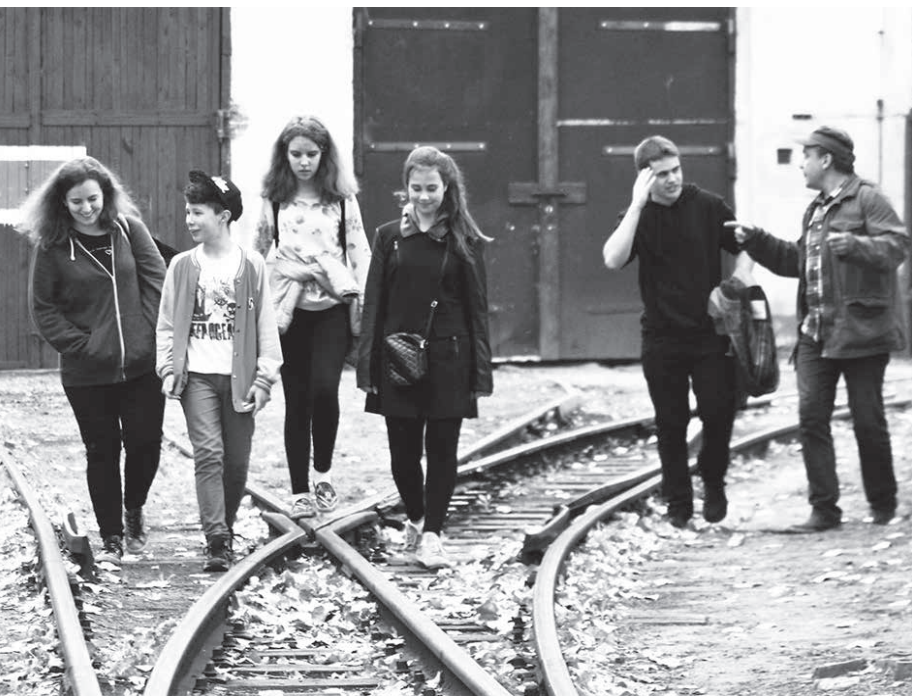
Wyruszymy „Po torach życia”!