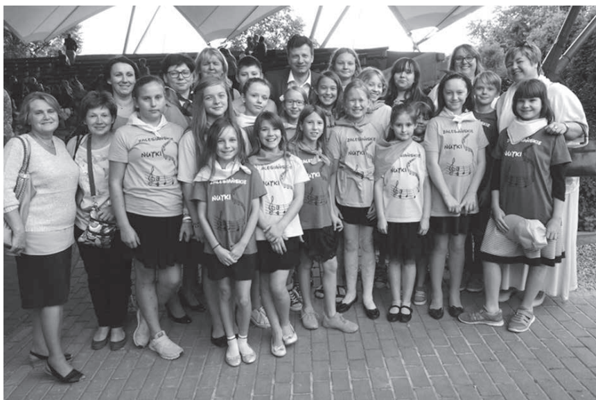
Piosenka, uśmiech i Zalesiańskie nutki

Festiwal powiązany był z obchodzonym 21 września Światowym Dniem Orderu Uśmiechu. Zgodnie z tradycją podczas koncertu odbyła się ceremonia wręczenia orderu. W tym roku to odznaczenie otrzymał znakomity aktor i reżyser, profesor sztuki Jerzy Stuhr znany dzieciom z dubbingu roli Osa w filmie „Shrek”. Jerzy Stuhr został 1001. Kawalerem Orderu Uśmiechu. Niewzruszony, ze stoickim spokojem aktor wypił sok z wyciśniętej cytryny, a następnie zauroczył wszystkich promiennym uśmiechem. Na koniec ceremonii świeżo upieczony Kawaler przysiągł „być pogodnym i dzieciom radość przynieść”. Nasi uczniowie z tej uroczystości wrócili nie tylko z niezapomnianymi wrażeniami, ale również